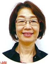
監修 梶谷 朱美 先生