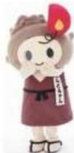
『大田市マスコットキャラクターらとちゃん』