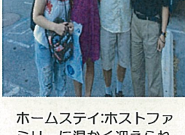
ホームステイ:ホストファミリーに温かく迎えられて。