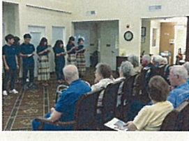
高齢者ナーシングホーム：言葉を越えた交流がありました。