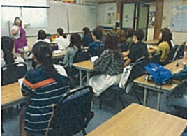
熱心に聞き入る学生たち