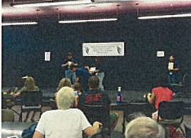
語学研修で発表した寸劇