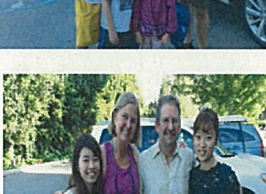
ホームステイ:ホストファミリーに温かく迎えられて。