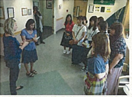
WVCナーシング・ラボ