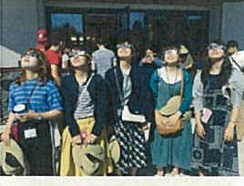
語学研修中の皆既日食