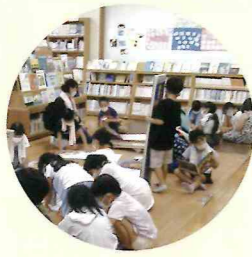
団体でのご来館も大歓迎です。