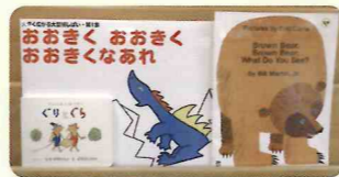
団体貸出についてもご相談ください